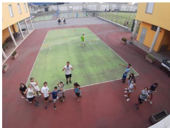
Gli azzurri durante i giochi