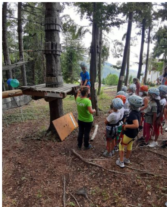
Gita a Zambla